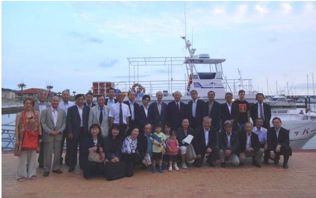
最終例会 (フリッパー号)